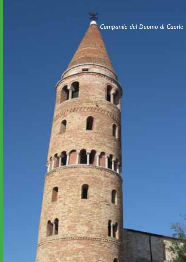
Campanile del Duomo di Caorle

Dai testi di Plinio il Vecchio, storico latino del I secolo d.C. si apprende che il nome antico della Livenza era Livencia , dal verbo latino livere , “essere scorrevole”. Nel corso del Medioevo il nome subì alcune trasformazioni fino ad essere chiamato