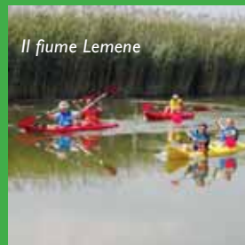
Il fiume Lemene

Il Lemene è anch'esso un fiume di risorgiva, che nasce nella bassa pianura friulana tra i comuni di San Vito al Tagliamento e Casarsa. Le sue acque limpide scorrono fino a Portogruaro dove si uniscono a quelle della roggia Versiola e del fiume Reghena. Dopo aver attraversato il centro di Concordia Sagittaria, il fiume sfocia nella laguna di Caorle.